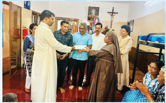
On the occasion of St. Joseph's day, St. Francis De sales Church Jakkur Pithruvedi unit visited Trithwa Ashrama (Akasha Paravakal) along with Parish Vicar and served food and offer financial support.