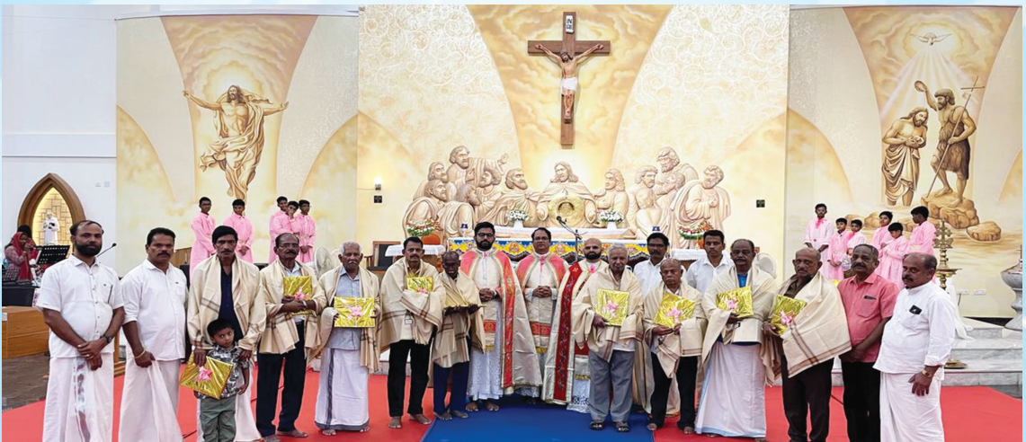
ക്രൈസ്റ്റ് ദി കിംഗ് ചർച്ചിൽ നടന്ന ഊട്ടു നേർച്ചയിൽ പ്രായമായ പിതാക്കന്മാരെ ആദരിച്ചപ്പോൾ.