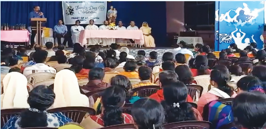
St. Joseph Feast along with Ottunercha at Kasavanahally